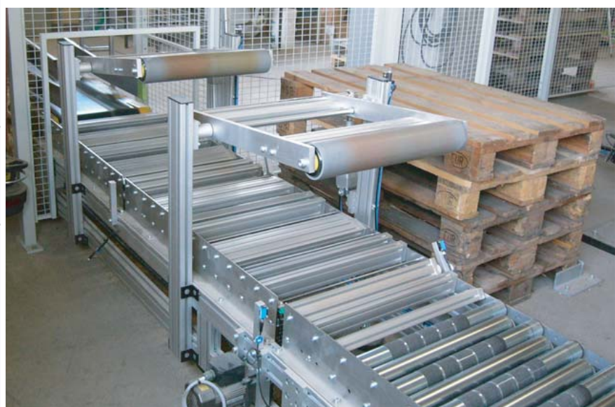
Spezialrollenbahn zur Förderung, Komprimierung und Glättung mit Abhebehub.