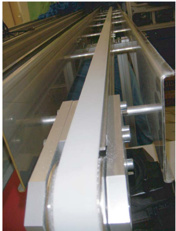
Förderband mit Riemen.