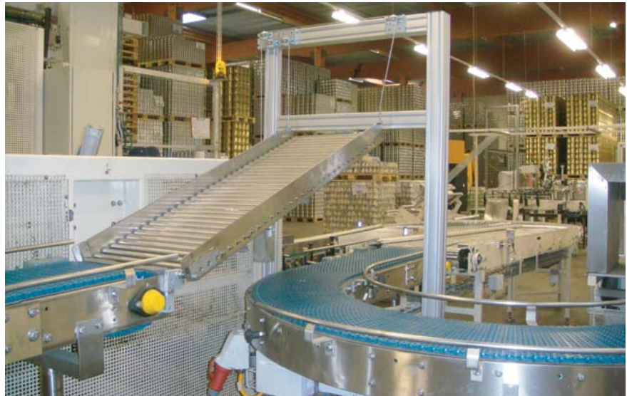
Rollenbahn und Hebevorrichtung.