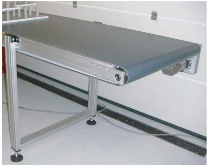
Förderband mit Gurt.