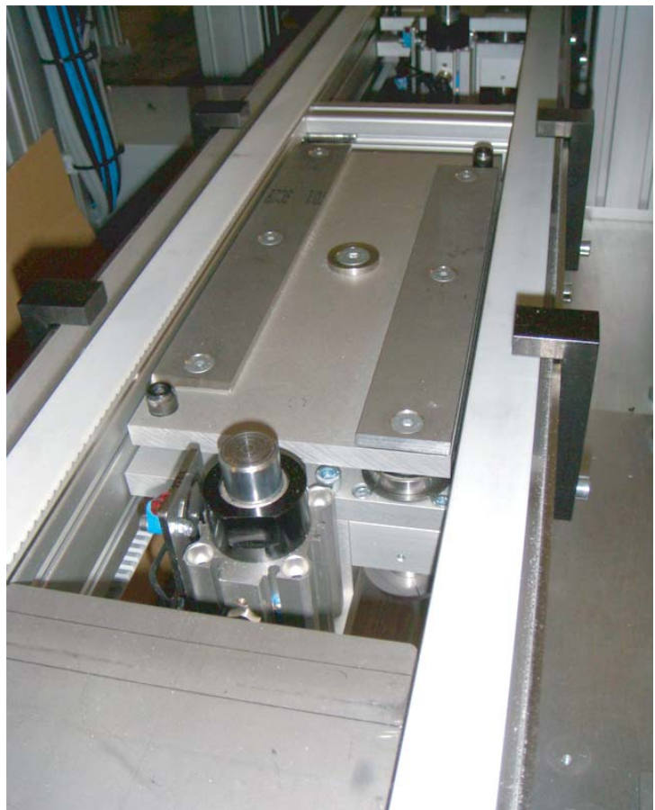
Umlaufsystem für Werk- stückträger mit Stopper, Hub und Überwachung.