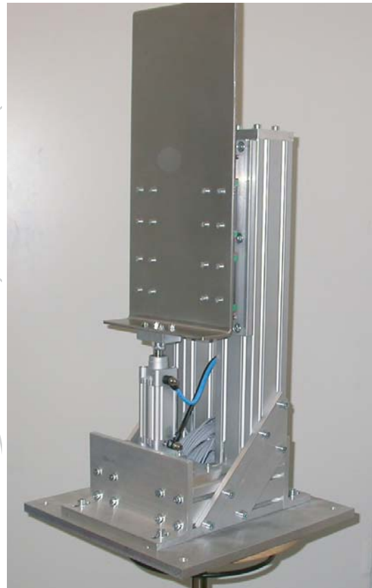
Stopvorrichtung für Produkte auf Rollenbahnen.